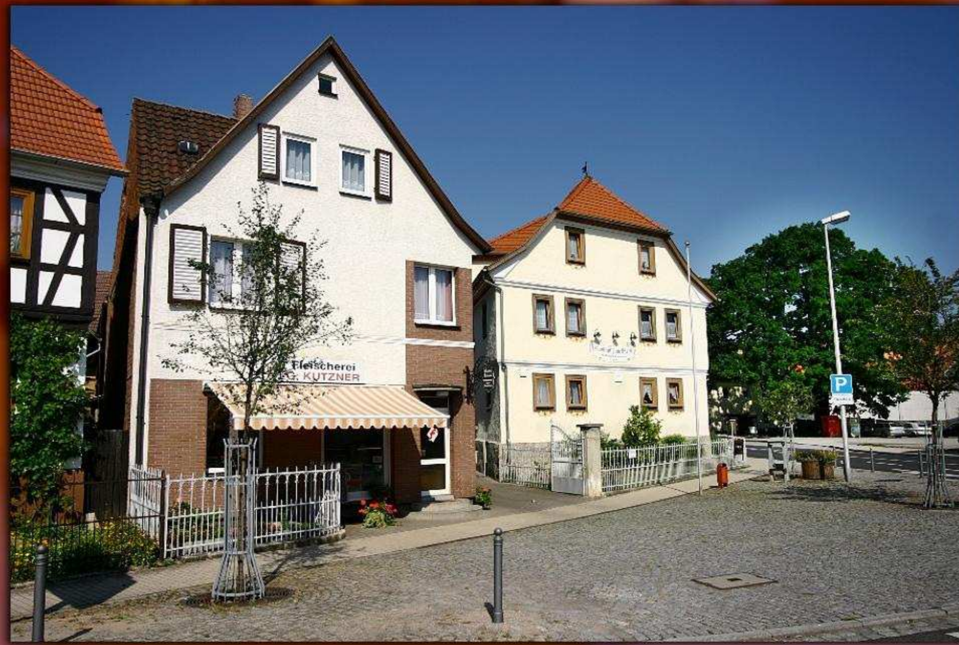
► Gasthof mit anliegender Metzgerei

Die günstige Lage vor den Toren der Theaterstadt Meiningen, bietet auch Wanderfreunden und Radtouristen die beste Möglichkeit zur Einkehr, Rast und Stärkung.