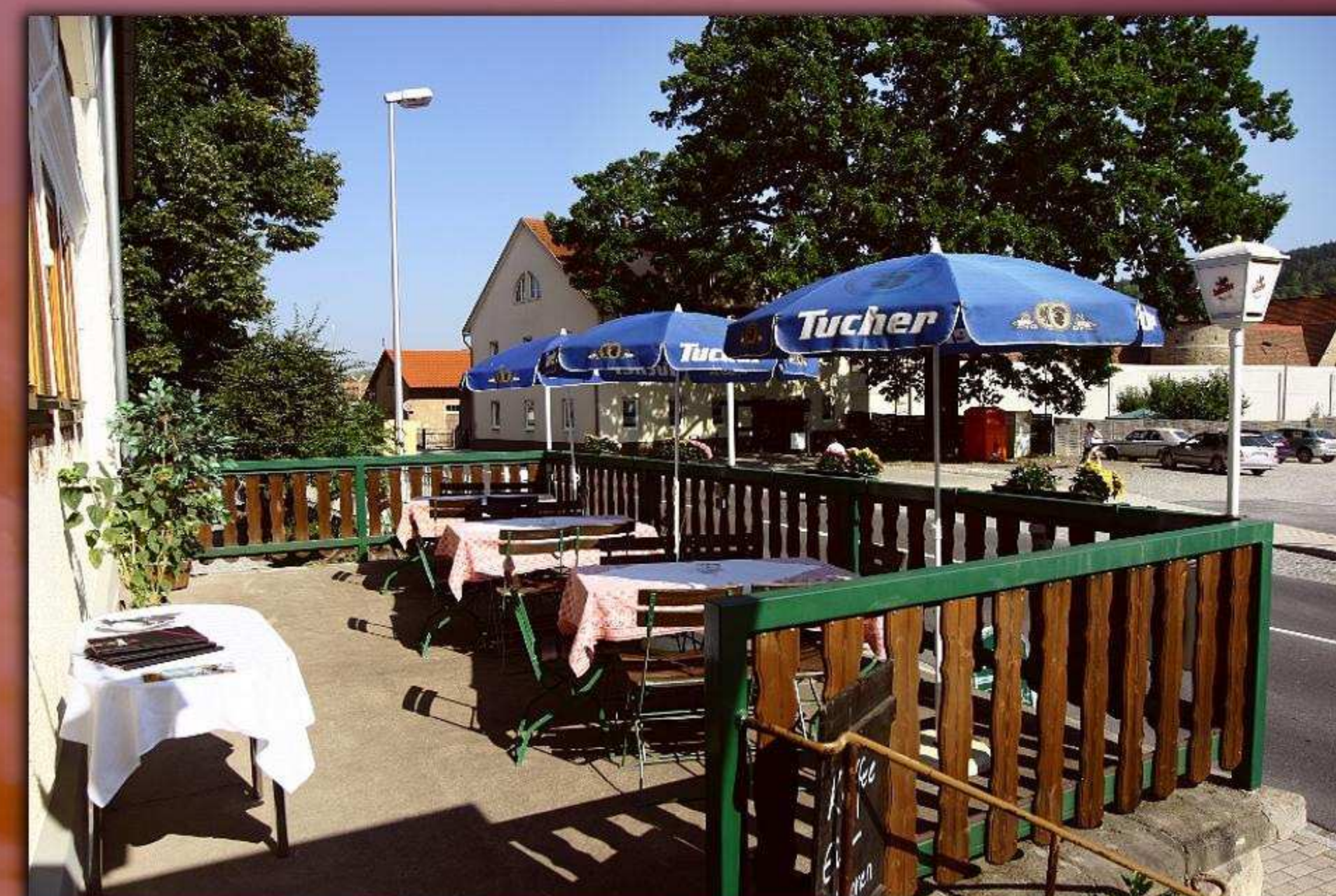
► Biergarten - in Ruhe genießen