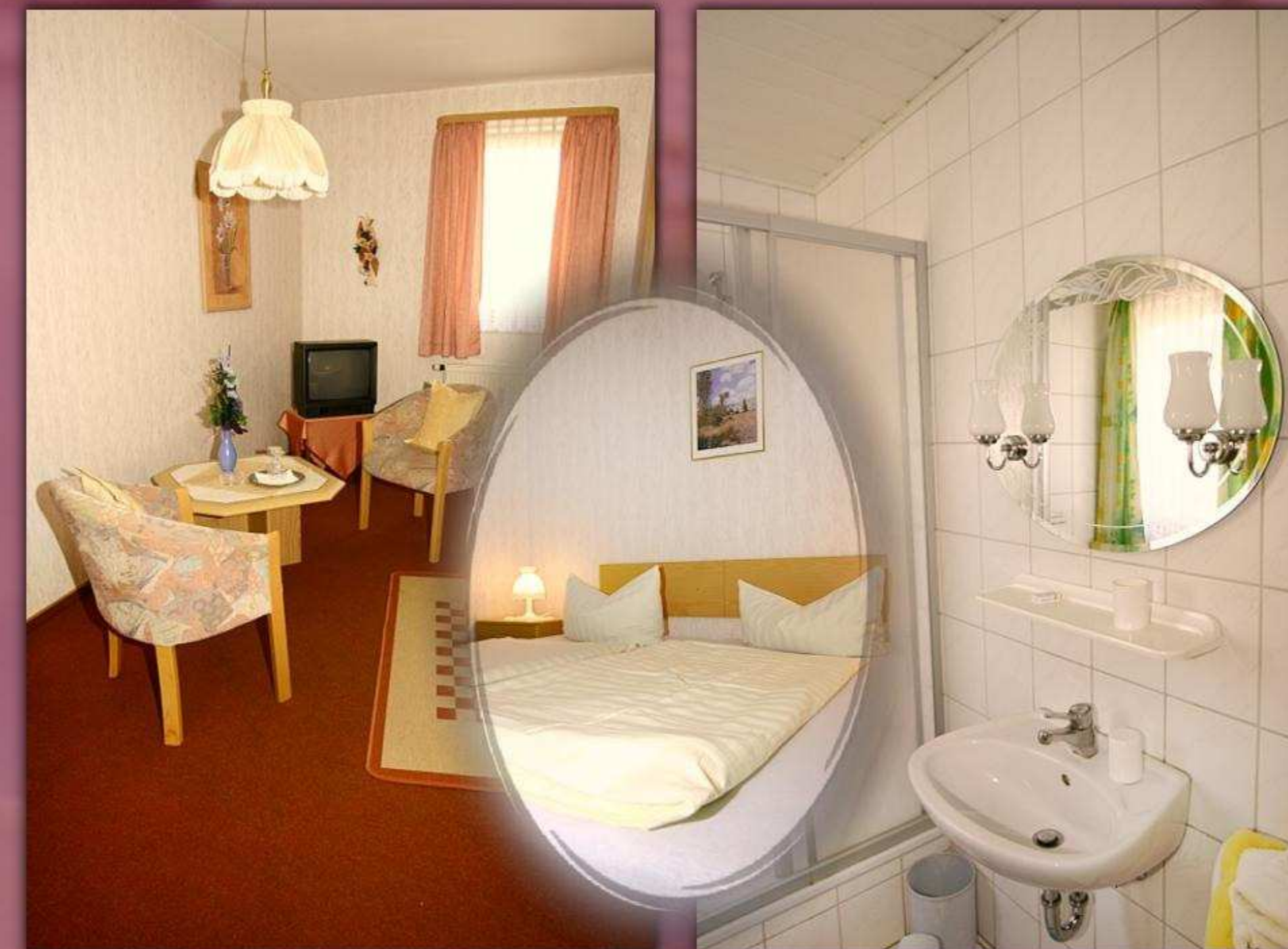
► Fremdenzimmer mit DU/WC/TV