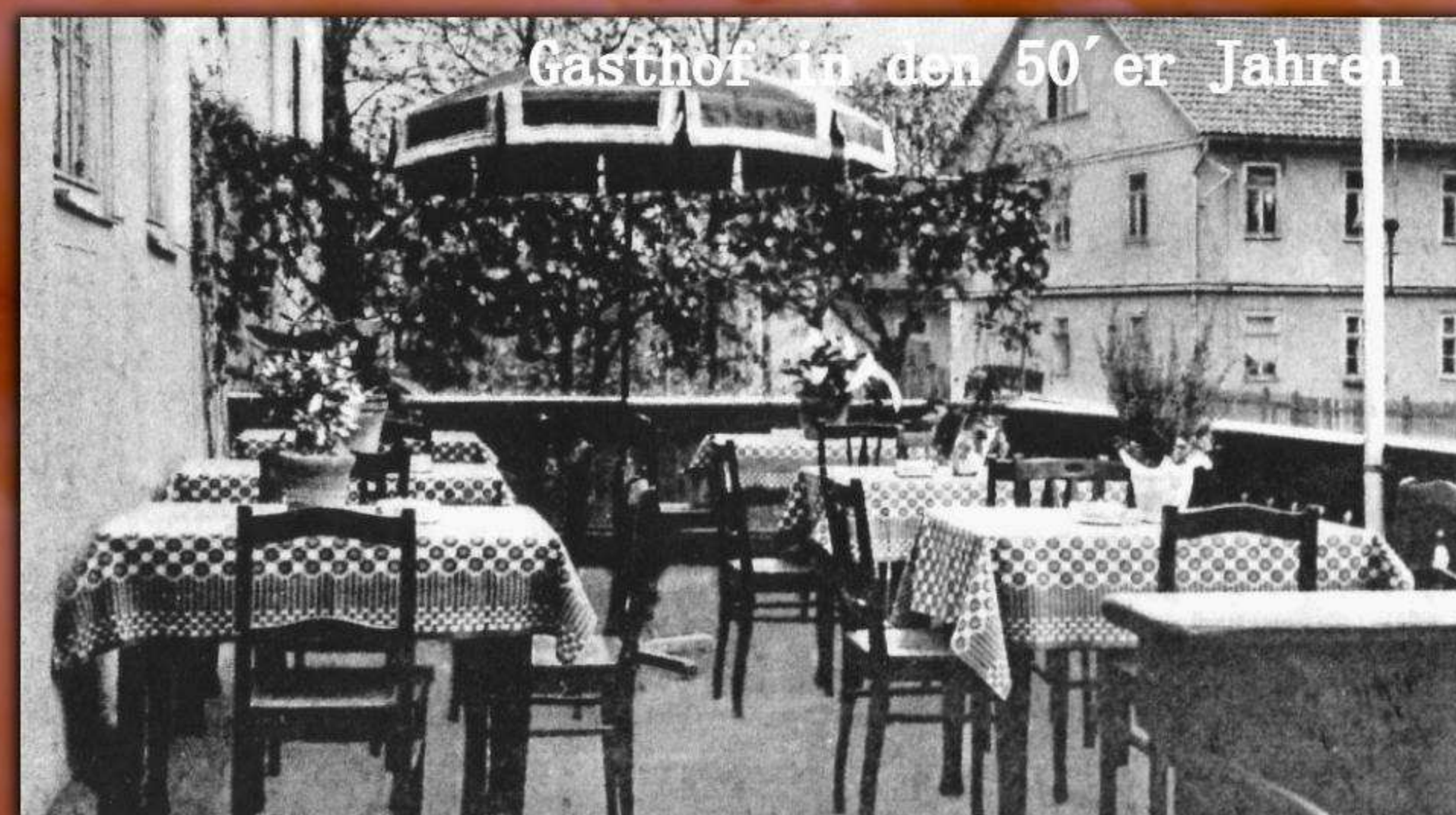
Und am Morgen, bei schönem Wetter, ist es ein Genuß, auf der Veranda vor dem Hause, sich sein so reichhaltiges Frühstück munden zu lassen.