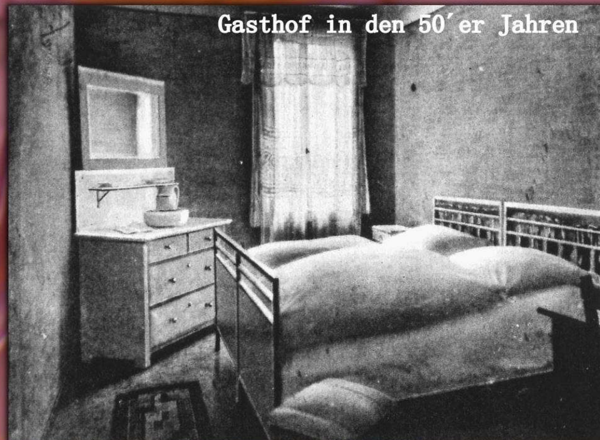
Und für die Nacht, ein behagliches Zimmer mit schönen, weichen, sauberen Betten.