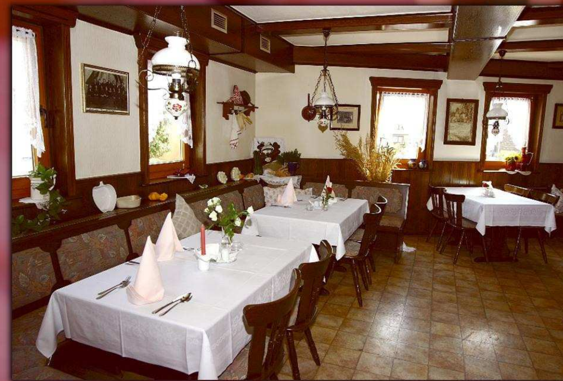
► Gastraum & Restaurant