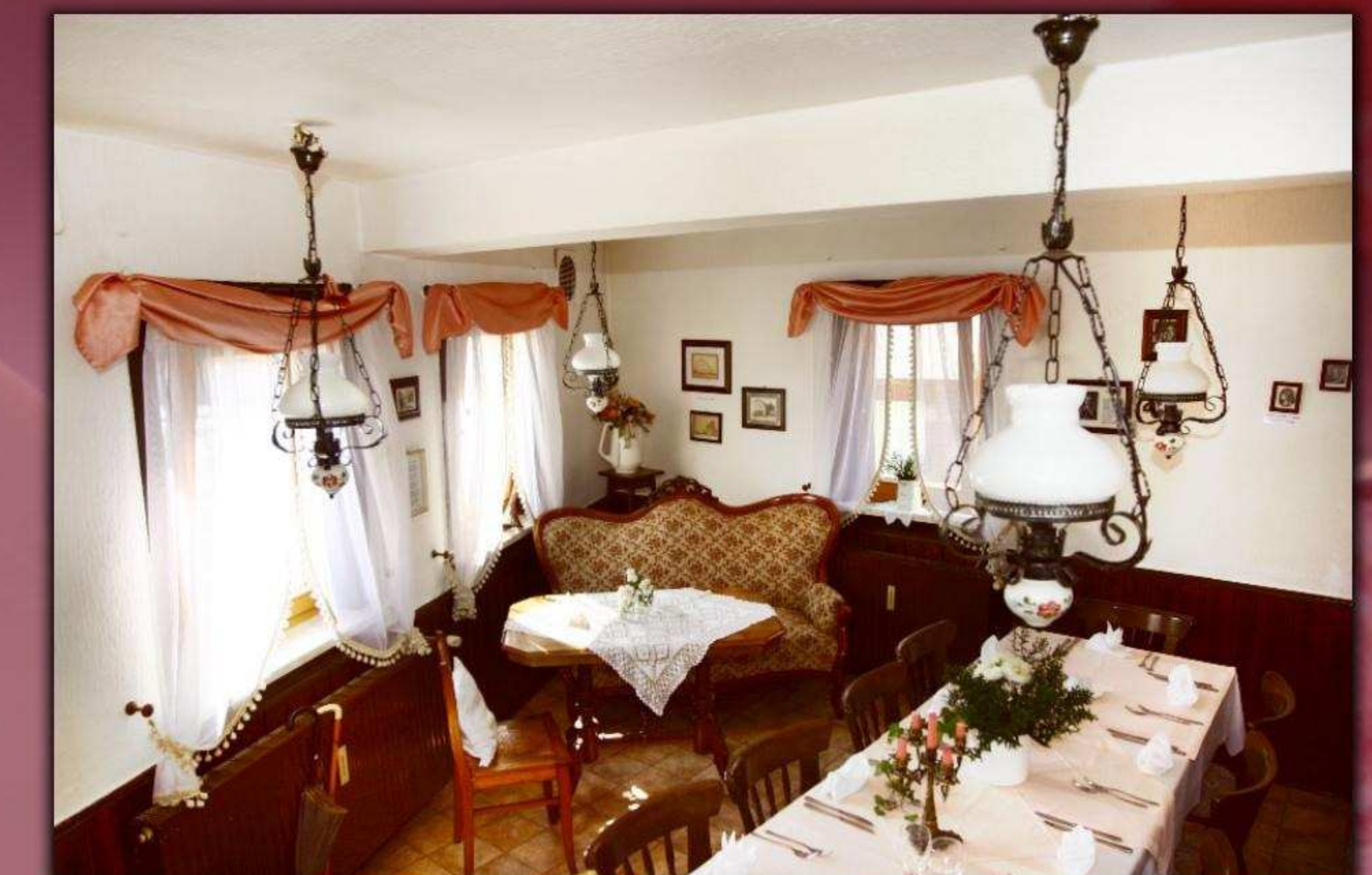
► Historische Schillerstube