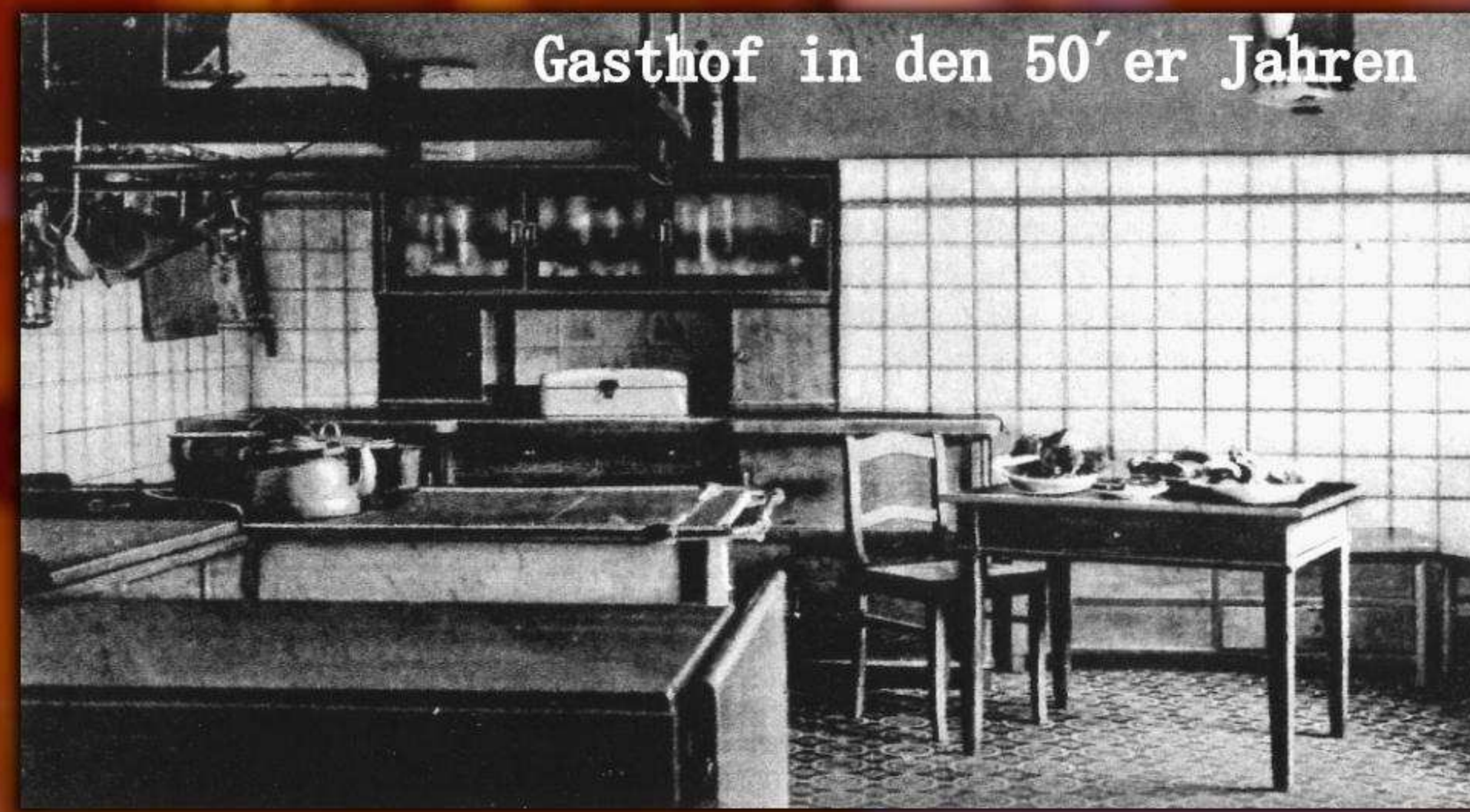
Abends beim Eintreffen verspürt der Fremde ein so angenehmes Hungergefühl. Hier in dieser schönen und sauberen, mit Fliesen ausgelegten Küche werden die schmackhaften Speisen hergerichtet.